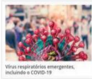
Vírus respiratórios emergentes, incluindo o COVID-19

O ambiente virtual de aprendizagem do SUS - AVASUS disponibiliza curso a distância sobre Vírus respiratórios emergentes, incluindo o COVID-19, para profissionais de saúde e comunidade em geral. A formação tem como objetivo descrever os princípios fundamentais dos vírus respiratórios emergentes e como responder efetivamente