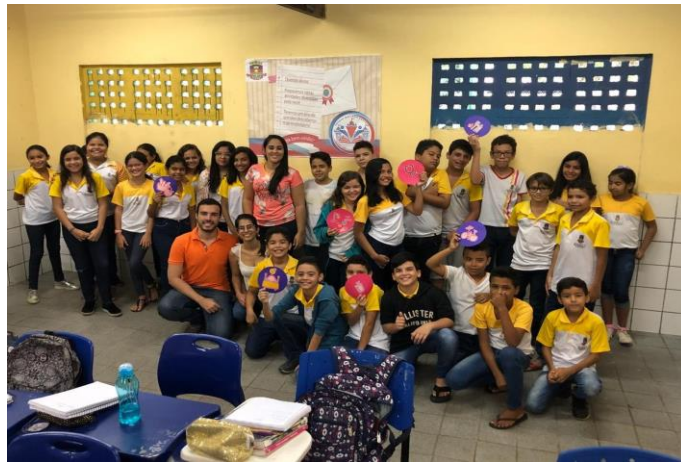
Escola de Saúde Visconde de Saboia apoia ações no Centro de Saúde da Família Coelce na Semana Saúde